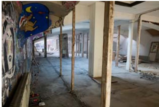
Cet espace de la future Bibliothèque publique de Neuchâtel sera dévolu aux enfants et adolescents. LUCAS VUITEL