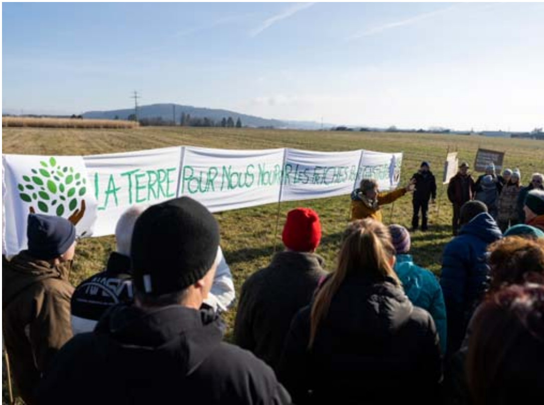
Les opposants au pôle économique de Littoral Est (ex-pôle de La Tène), qui prendrait place à proximité des centres commerciaux de Marin, sont nombreux.

Pour le gouvernement, les terrains de ce pôle «offriront une solution équilibrée et planifiée, valorisant chaque mètre carré de terrain dédié à l'activité économique. La création de ce pôle de développement économique est incontournable pour renforcer l'attractivité du canton et accueillir des emplois qualifiés dans des conditions adaptées», a-t-il précisé. Le Pôle de développement économique (PDE) Littoral Est devrait créer une zone d'activités capable d'accueillir environ 3000 emplois dans des secteurs à haute valeur ajoutée. Un éco-quartier de 500 habitants est prévu, tout comme des équipements publics et une bonne